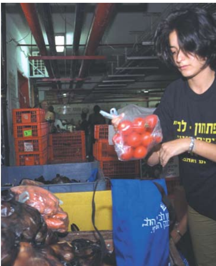
מתנדבת באיגוד 'פתחון לב', ראשון לציון 2002

תארו בקשרה את הפעולה וכיצד ניתן ליישמה בבית הספר.